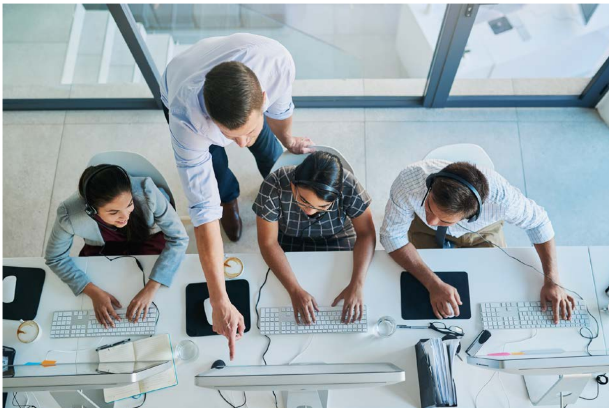
Figure professionali dei Percorsi per le competenze trasversali e per l'orientamento – PCTO